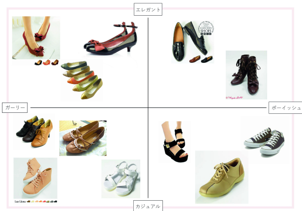
図3 レディースシューズマッピング

今日ファッションアイテムとして一般的に着用されている女性用の靴にはパンプスやブーツ、サンダルなどの様々なものがある。まずはそれらのジャンル傾向を知るために、縦軸を「エレガント⇄カジュアル」、横軸を「ガーリー⇄ボーイッシュ」としてマッピングした(図3)。