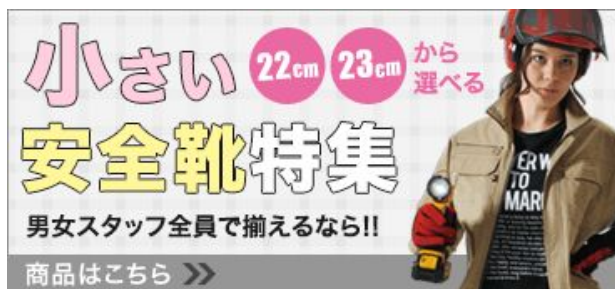
図1. 上) ミドリ安全株式会社「ワーク女子力」、下) 通販サイト「ワークユニフォーム」

しかしその既存の商品の多くが男性用にデザインされたワーキングシューズのサイズをそのまま変更しただけのが多く、完全な「女性用」とまでは確率されているものは少ない。そこで機能面とファッション面を両立させたレディースワーキングシューズが必要なのではないかと考え、これを