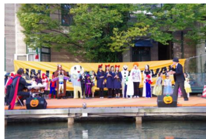
図4 仮装コンテストの様子 6)