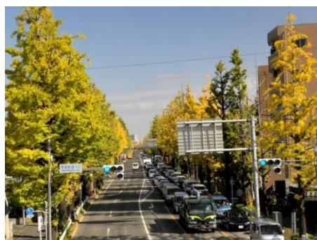
図3 イベント会場例 5)