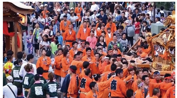
写真 1 2017年7月23日上溝祭り

祭りは7月下旬の土日に2日間開かれ30万～40万人の人が訪れるほど大きな祭りとなっている。