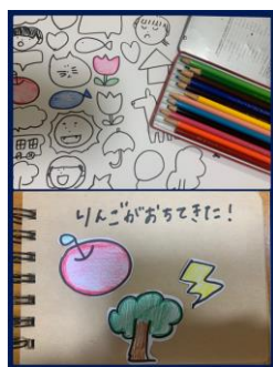
図 2 手づくり絵本見本

いた。「絵本」から得られる教訓は小学生のみならず、中学生・高校生にも与える影響は大きいと考えられる。